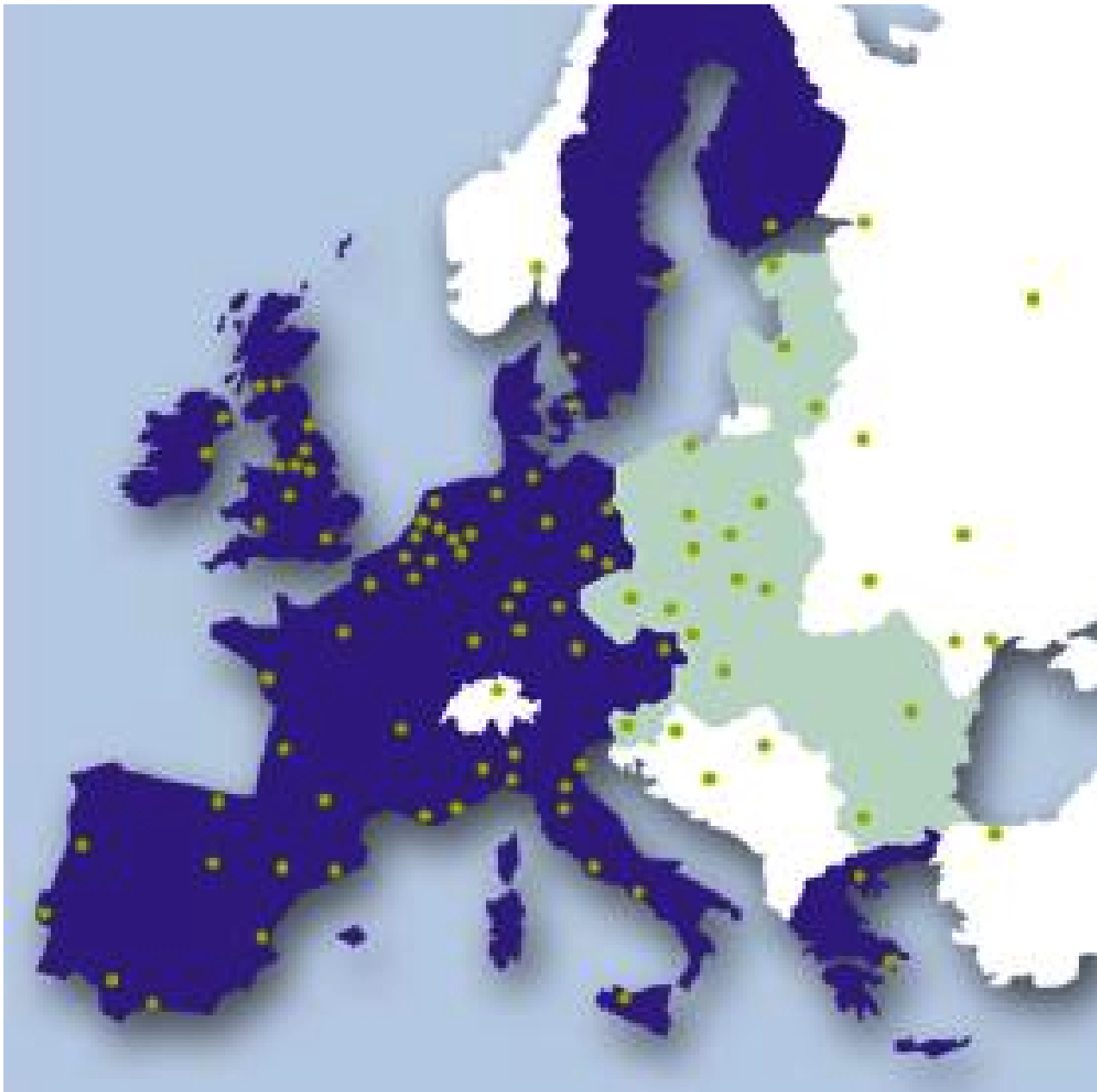
FIGURA 1 — Le regioni e le aree metropolitane dell'Europa